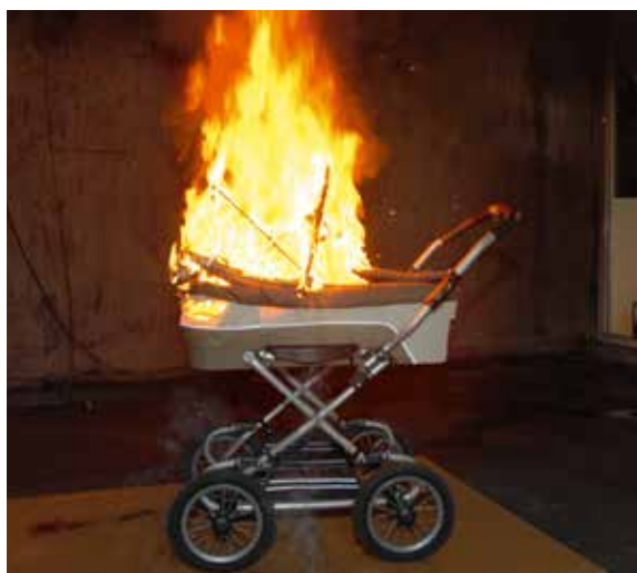
Håll trapphuset fritt från brännbart material och sådant som är i vägen vid en utrymning.

uthyrningen är det lämpligt att den som hyr ut lokalen för en dialog med hyresgästen om hur brandskyddet är tänkt att fungera när det gäller utrymningsvägar, tillåtet antal personer, eventuella larm med mera. I vissa fall kan det också vara lämpligt att tillsammans gå igenom lokalen/lokalerna innan de tas i bruk för arrangemanget. Det bör också finnas någon form av skriftlig brandskyddsinformation och checklista till hyresgästen. Sådana bör också vara uppsatta i lokalen.