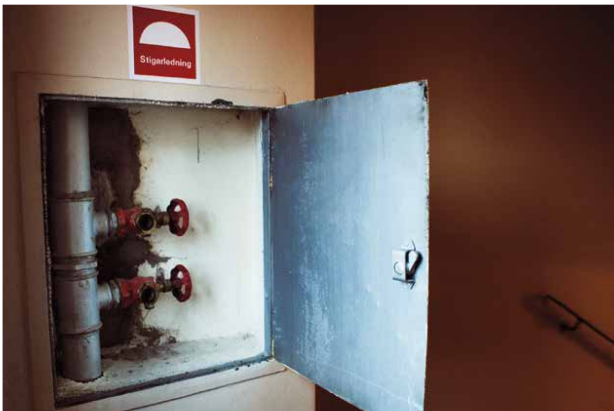
Via stigarledningen i trapphuset får räddningstjänsten vattenförsörjning utan att behöva dra slangar hela vägen från bottenvåningen.