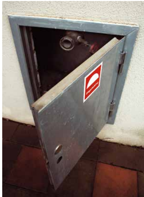
I stigarledningen i luckan på fasaden kan räddningstjänsten koppla in vatten. Inne i trapphuset finns sedan uttag där slangar kan anslutas.

I trapphus utgörs brandventilationen ibland av vanliga öppningsbara fönster. Det är viktigt att se till att lekande barn inte kan falla genom dessa. För att hindra olyckor kan exempelvis ett utvändigt galler användas.